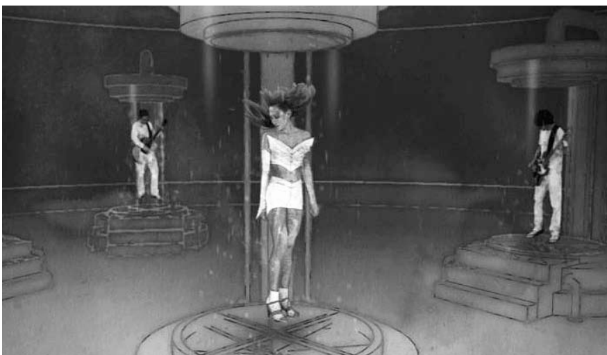
Racoon – Clean Again