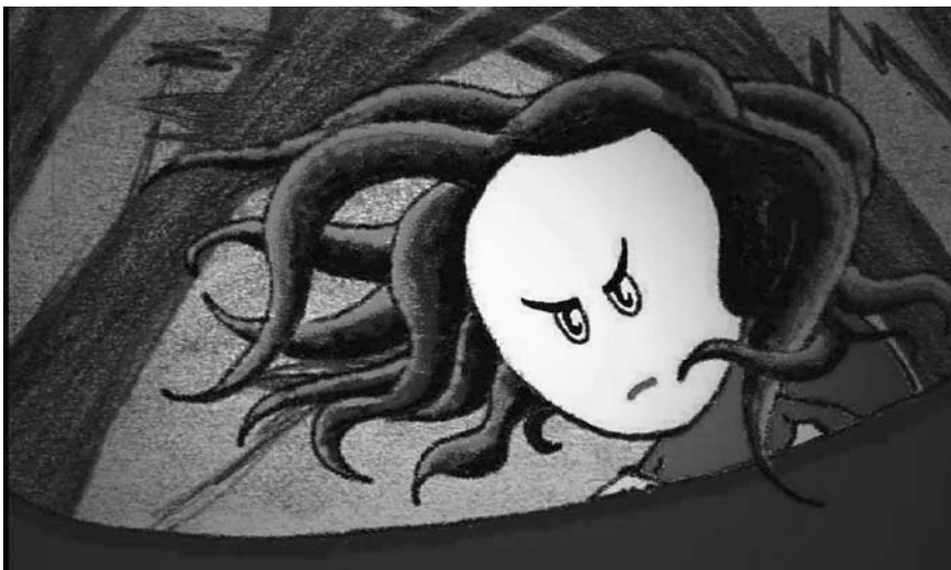
Ghost Trucker – Under The Stars